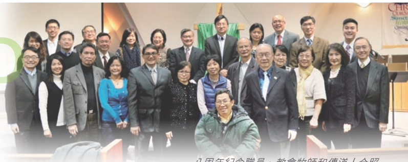
八周年紀念職員、教會牧師和傳道人合照

職典禮」：回顧八年，上帝一直帶領和看顧，更把兩位資深傳道人，帶來加入我們的團隊。