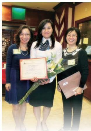
2014年周六課堂畢業學員