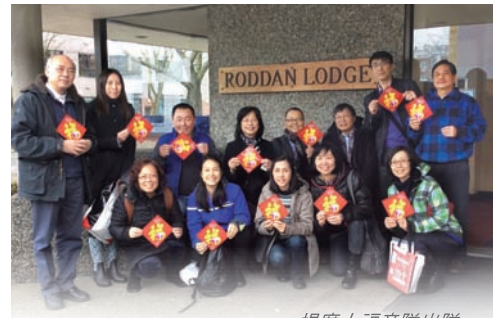
提摩太福音隊出隊