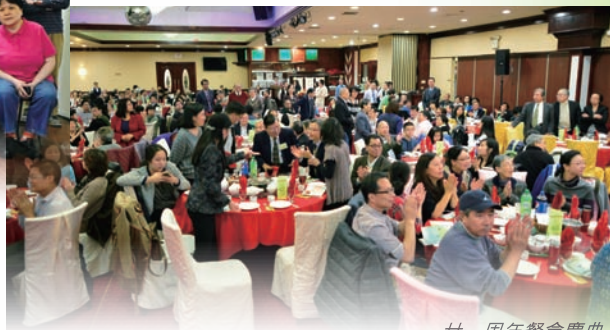
廿一周年餐會慶典

在短宣訓練當中，我們期望信徒不單學習佈道技巧，更重要讓他們的靈命更新。感謝神！自2010年舉辦有系統的個人佈道訓練，受訓學員也感受到靈命得以長進，並能主動在佈道事工上服侍教會。去年福音藥房的成立，更見證了帶職宣教事工中，信徒以專業及金錢全人奉獻給神，秉承職場傳道的目的。這一齊成為感恩之祭奉獻給我們天上的主。還有，我們要感謝各教會及信徒們在祈禱及金錢上支持我們。當我們在經濟困境中，您們對短宣中心的事工，仍不離不棄以金錢奉獻我們所需。願神親自報答您們。