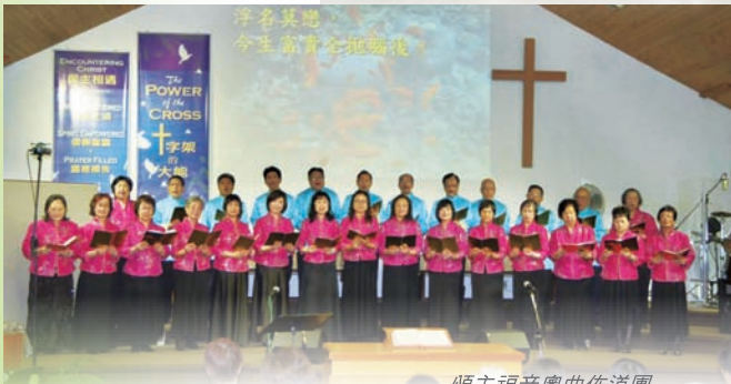
頌主福音粵曲佈道團