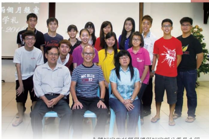
全體短宣生於開學禮與短宣部分委員合照