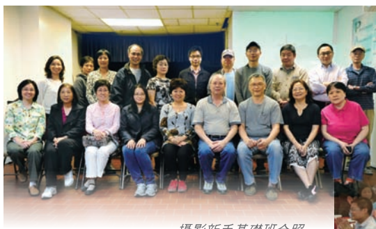
攝影新手基礎班合照

在中心的發展當中，起初數年我們並沒有屬於自己的基址，一直只能借用教會舉辦課程。及至1999年藉著信徒愛心奉獻，中心遷入位於Union St基址，至2010年才搬往Main St。因著經濟下滑奉獻減少，加上新物業開支增加，確實導致中心財務虧損。但慈愛的天父，祂是信實的。在本年二月份，神親自為我們預備了佳美之地，中心新基址位於法拉盛 140-44 34th Ave，地面半土庫面積1375尺的單位，並附有車位，而售價也是同區最平，現只需十多餘萬，這大大免去中心財務壓力，長遠可增聘同工，有利中心事工發展。感恩無論在各種逆境中，仍能順服神，以神的安排為滿足，並以信心前行，常存感恩的心。