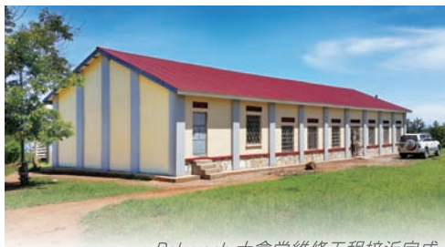
Pakwach 大會堂維修工程接近完成