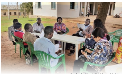
生命小組培訓核心教牧

Jonam區在教育方面也有很大的需要，所以從2013年7月Jesus Loves Jonam開始以來，已完成了3間學校的裝修工程。在Panyimur有一間小學，其中一棟教室由於沉降，牆壁出現裂痕，另一間教室連屋頂也被風吹走，更已有部份倒塌了，所以校方計劃興建兩間有四個教室及辦公室的樓房，可是由於沒有資金，學生們有部份課堂只能在樹下上課。有1位弟兄受感動要幫忙這工程，但是目前經費不足，請為此需要禱告，希望這工程能早日完成。