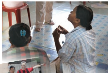
亞庇斯小額貸款婦女聚會