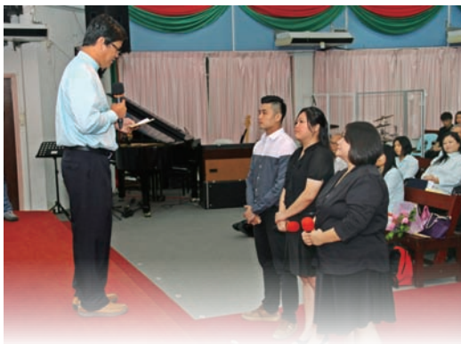
於結業禮中接受差遣