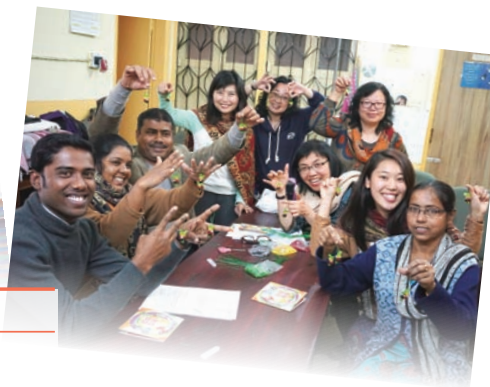
教印度同工造福普工具