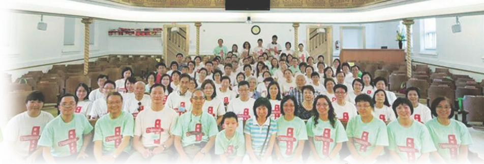
「耶穌愛華埠」參加者合照

間，接觸575人，決志32人，求主繼續感動信徒在這末世中勇敢為主作見證，傳揚救世的福音。