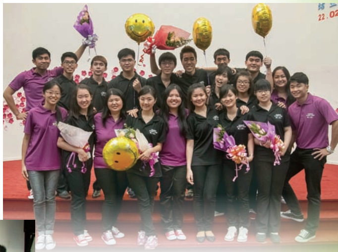
結業禮與弟兄姐妹同喜樂