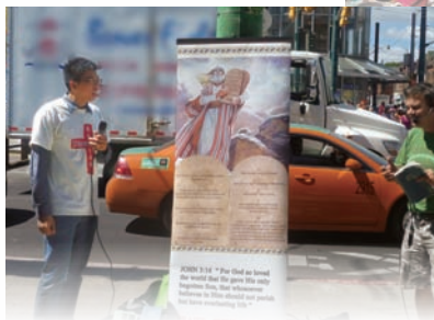
「耶穌愛華埠」街站佈道