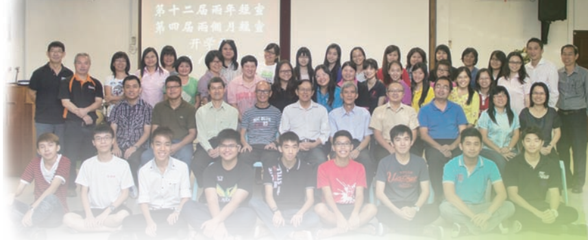
開學禮與教會領袖、牧者、弟兄姐妹、家人合照