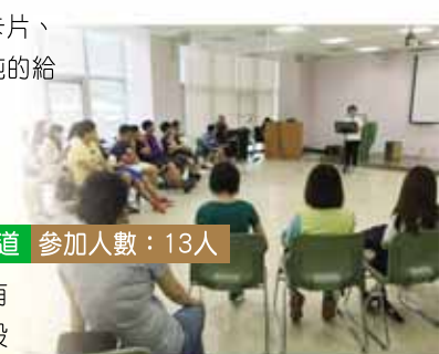
明志科技大學佈道會

短宣隊五日四夜住進院內的四個小家，與30多位孩子一同生活。短宣隊每天早晨都會帶領孩子唱詩歌與查經，甚至透過生活化的經文小卡，教導運用小工具與同伴傳福音；也一起玩桌遊、運動打球、做手工卡片、做蛋糕...等活動。睡前孩子們也會圍著短宣隊員聊天，聽他們分享自己的生命見證。其中一個孩子單純的給了隊員回應一句「我愛你，因為你來跟我玩！」看見主的愛臨在孩子們當中，無限感恩，榮耀歸神！