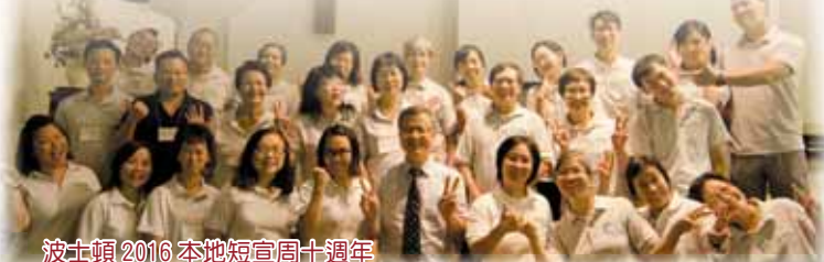
波士頓2016本地短宣周十週年