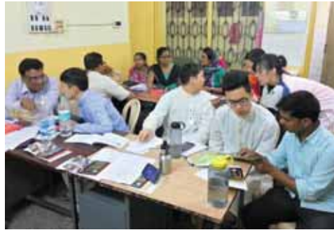
印度：訓練當地信徒使用《珍貴福音》佈道畫冊

事奉及統計 佈道統計： 談道 99 人、決志 17 人、慕道 3 人、 澄清 20 人、探訪 10 家、跟進 2 人、 派出 390 張福音單張 佈道聚會：2 次 (共：113 人次) 訓練聚會：5 天 (共：140 人次)