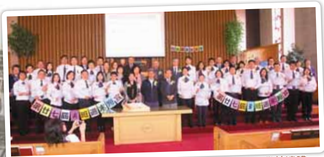
第27屆周末短宣畢業差遣禮