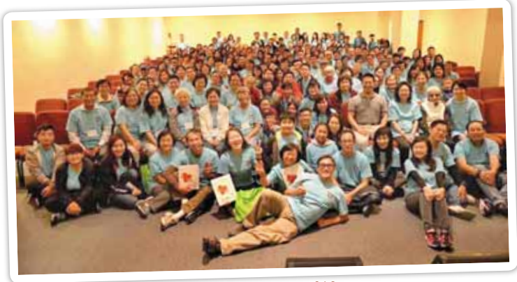
三藩市灣區 JLC 2016

「耶穌愛華埠」的概念是一個跨宗派堂會的本土宣教大行動。早在2005年，紐約華埠教會由自辦的暑宣體驗到邀請紐約短宣中心聯合眾教會舉辦一年一度「耶穌愛華埠」見證聖靈使教會在佈道上合一工作，榮耀歸神！現在波士頓、多倫多、三藩市、芝加哥、悉尼陸續產生每年一次「耶穌愛城市」聯合佈道，願更多華人教會能夠復興起來，合一宣教。