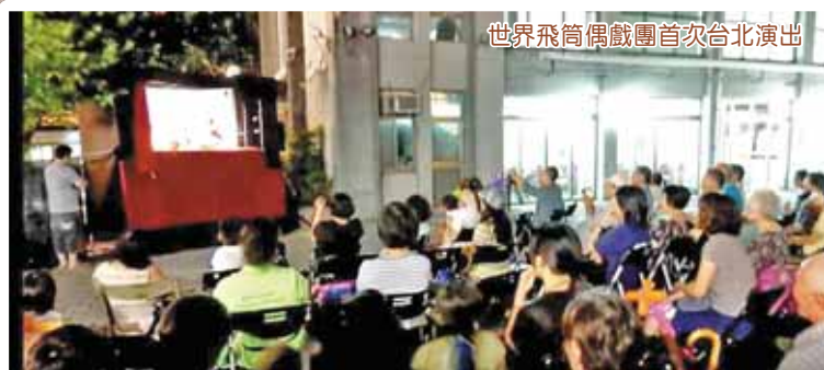
世界飛筒偶戲團首次台北演出