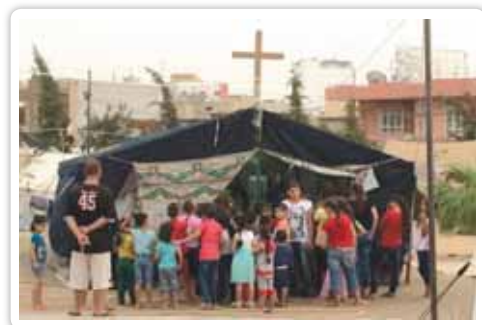
基督徒幫助伊拉克埃爾比勒 (Erbil) 難民帳篷教會