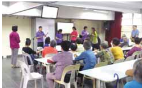
新加坡：講解「一刀剪」，一刀剪出十字架講福音