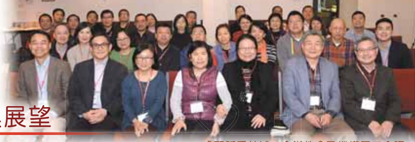
「耶穌愛芝城」合辦教會及機構同工合照