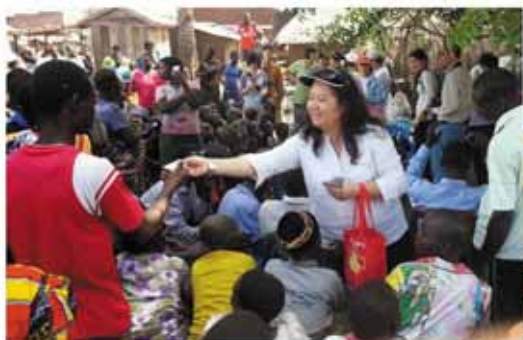
2013年1月31日 抵達烏干達跨文化工作