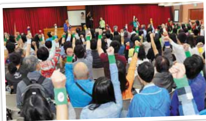
國宣大會 - 人人參與，超過兩百位參加者彼此打氣！

現代的變化，產生了網絡宣教士(Cyber Missionary)，特別是進入創啟地區，非常有效。因應