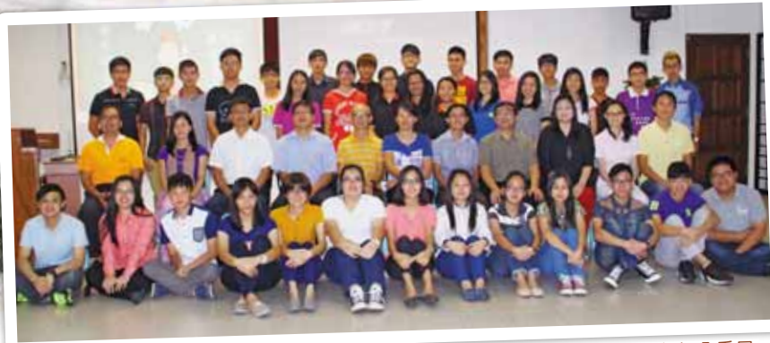
兩個月短宣生與部分委員

兩年的裝備，學生共修讀27門課程，包括聖經科、神學科/歷史科、實踐科/事工、靈命生活科及宣教/差傳等。在實習部分，中心也著重學生們的實習操練。兩年裝備中，短宣生們在街頭、住家和醫院裡共派發了873張的單張，164人次的探訪，向20人傳福音，以及348人次的參與教會團契、禱告會等事工。