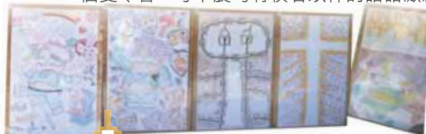
gospel boards 福音畫板

「耶穌愛華埠」不單只是一個傳福音的行動，也是一個夏令會，每早晨均有牧者以神的話語激勵我們。