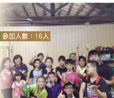
關西客家村英文班

短宣隊到過明志科技大學舉辦聚會，與大學生接觸。短宣隊預備了話劇佈道，雖然事前預備的時間有限，排練時也不太協調，但最後也能順利演出，更有大學生決志信主，感謝主！短宣隊也跟附近的五股福音堂、蘆洲長安基督教會一同出隊佈道，碰巧是當地的中元節(鬼節)，深刻體會到當地人「拜拜」(拜偶像)的風氣很盛，甚麼都拜，但其實心中沒平安，很需要平安的福音，讓他們得著真平安！