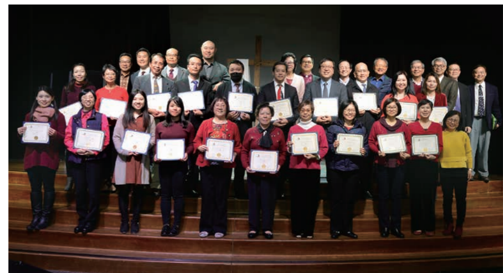
異象分享暨畢業禮餐會

如果教會的對象是唐人街的華人，就需要鼓勵信徒，主動接觸、探訪街坊，切勿把責任放在一小