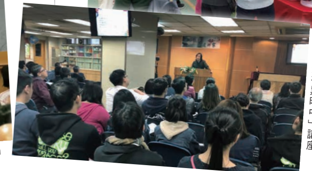
「職場宣教與牧養運動—光在黑暗中」講座