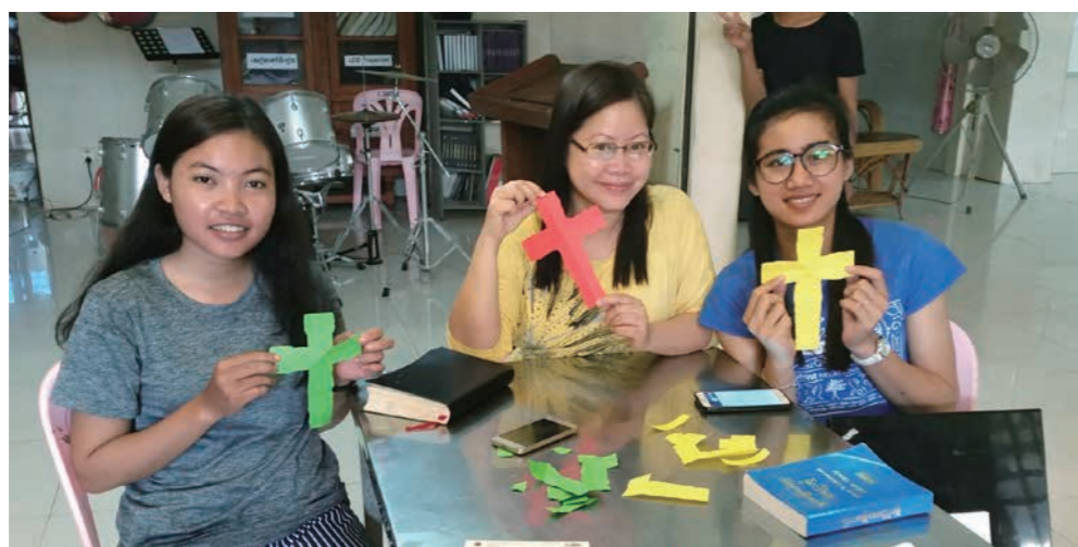
教導當地人傳福音