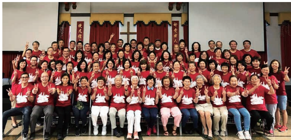
北區國語團體合照