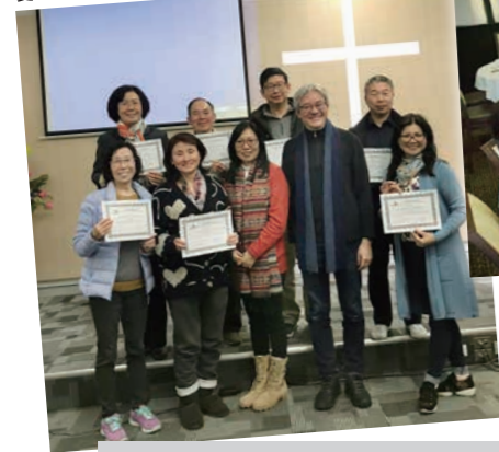
愛仁勇者佈道領袖訓練國語班結業禮