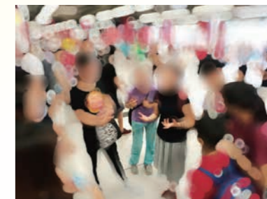
跟大專學生分享跨文化工作的挑戰

2019年發生的社運，讓我聯想起伊斯蘭極權統治下的不自由宗教制度、隱惡揚善的榮譽文化、掩耳盜鈴的生活態度、對不服從的人的逼迫等等。盼望神透過基督徒所表達的愛與和平，能在人前作美好見證，為受欺壓的人帶來安慰。也求神讓穆斯林能從這次事件中借鏡，他日回到自己國家時，也能超越信仰立場的差異，敢於向不義的行為說不。（續後頁）