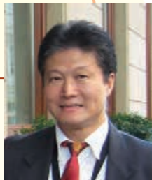
李志成博士 美國 NOAA 海洋及氣象研究 國宣美國大華府區代表