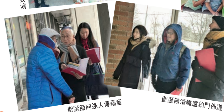
聖誕節向途人傳福音