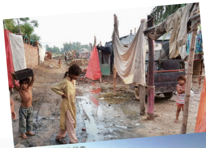
村裡有很多失學的兒童