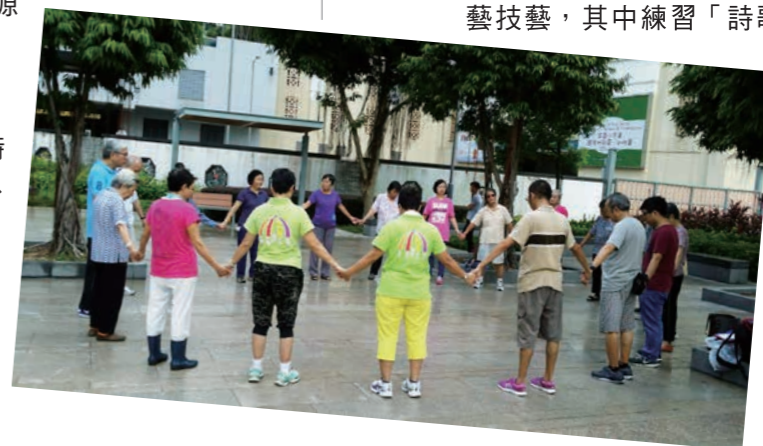
在「健膝操」運動中一同禱告

感到要走的路還很長，也很急迫，求主興起工人特別是年輕的弟兄姊妹，同心為福音，因為教會打算重啟幼稚園老師的事工，求主預備人手。