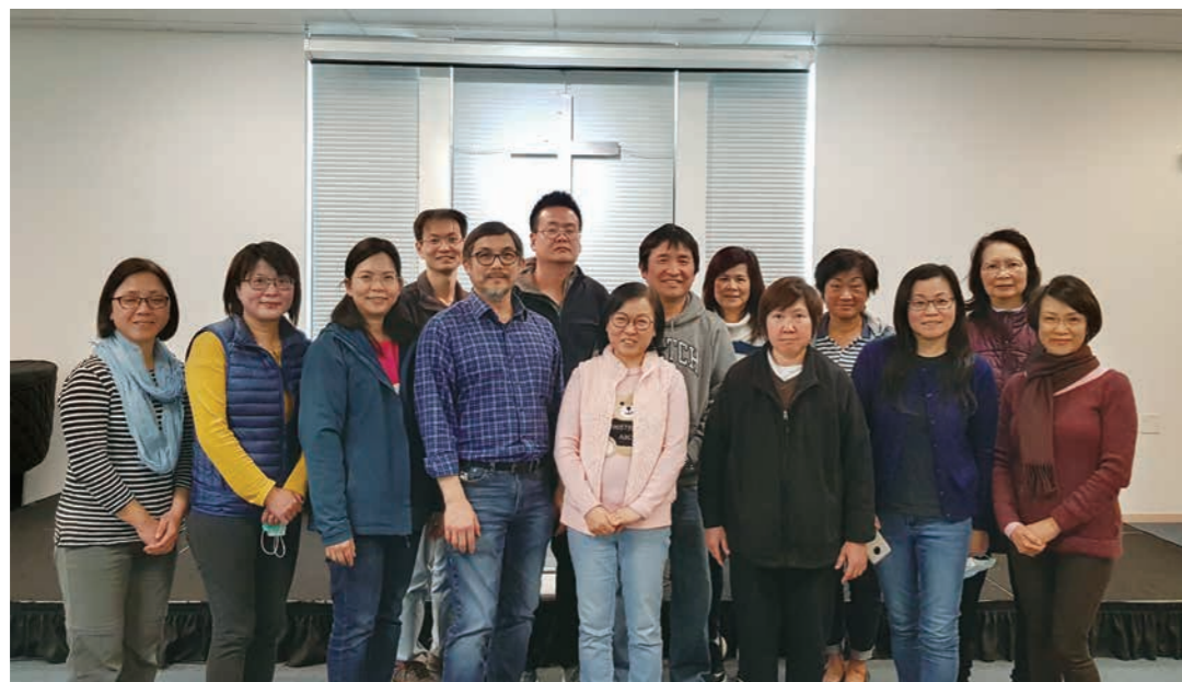
家居避疫令前夕 San Jose 佈道訓練基礎班合照