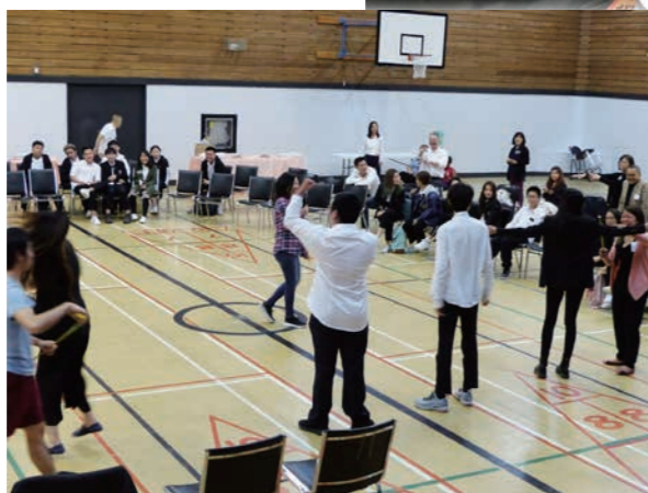
留學生中秋節聚會

筆者在香港長大、信主及成家，跟太太孩子到北美生活有廿多年，由工作到全時間事奉，身處移民家庭，從來都是典型城市人。就着芝加哥的事奉需要，十分願意跟主內兄弟探討「向芝加哥華人群體宣教的策略」，希望藉此分享能拋磚引玉，懇請佈道事工的先賢前輩加以指教。