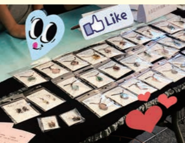
跟另一位同工試造手工飾品，希望發展營商平台

似乎神讓我在今年有更多空間發揮踏上宣教路前所學的技能，願主按祂的心意帶領，讓我更清晰自己的位分。