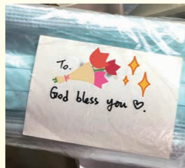
送給服侍家庭的應急物資

服侍家庭的口罩消耗量動輒不少，感恩不少友好單位機構送贈物資，使我們有足夠的資源可以按各家庭情況和需要分配。為了避免造成倚賴及誤會，我們上門送贈時會表明這些物資是其他信徒朋友送贈，也會主動提供抗疫資訊及鼓勵對象從不同途徑購買物資。