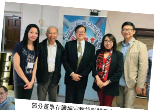
部分董事在職場宣教挑戰講座合照