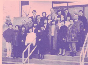
溫哥華短宣中心全體短宣及同工

奉獻抬頭請寫「香港基督徒短期宣教訓練中心」或"Hong Kong Christian Short Term Mission Training Centre Ltd." 註明代轉「國際短宣團契」