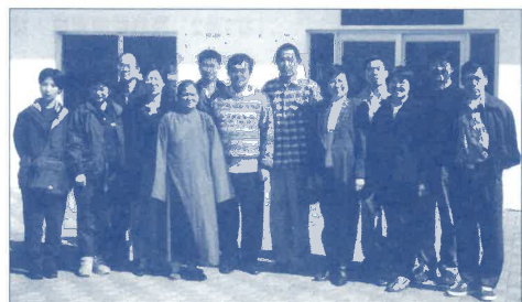
短宣隊由當地華人帶往佛光山與主持人「切磋信仰」。

此次聚首，神叫我看見的不再是一隻畸異的手，而是一隻奇妙的手，因為她曾經獲取了全南非高中組別繪畫比賽的總季軍，並且她的雕塑創作也曾多次獲獎，甚至有人出價收購她的得獎作品呢！然而我最為她開心的，是她是首位在眾兄弟姊妹中得到主救恩的人！