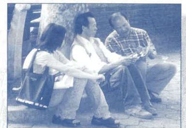
各區代表與紐約肢體一起到公園出擊佈道。