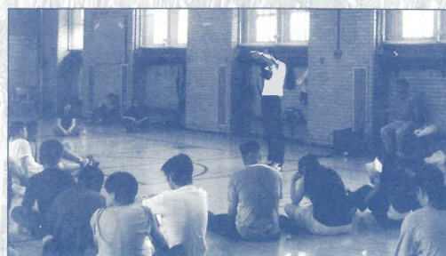
紐宣安排各區代表到紐約不同教會負責護教專題、佈道訓練、短宣異象分享及福音聚會。圖為同工應邀負責在籃球隊分享福音信息。