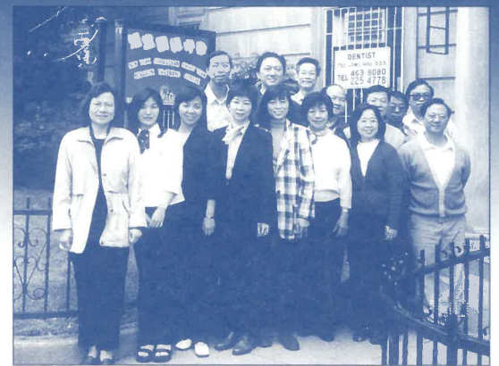
各區短宣中心代表在紐宣基址門前合照