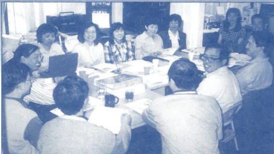
雖然各代表在紐宣辦公室召開兩天共六節交流會議，十分密集，卻十分享受彼此能激勵士氣，看大家的笑容便可猜想一二！