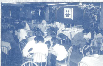
與紐宣董事們聚餐，大家分組為紐宣的人與事代禱。