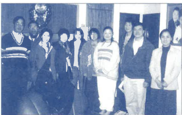
短宣隊在布魯芳登工業區佈道後，即時為初信者拆偶像。(右四是主人家)

由各方面的報導得知，南非自從黑人政府上台後，有才（財）有勢的白人陸續不斷撤離，致使國家經濟滑落，失業率高企，治安不穩。最使我們痛心的，就是當地華人被人視為弱勢群體，而一般華僑又是小康之家，故此往往成為黑人搶劫的主要目標；況且我們華人又因來自地區背景不同，維持在小圈子小集團內的活動是有的，但整體來說都是不相往來居多。老僑有老僑的活動，台灣來的有他們的交際圈子，中國大陸來的有他們的拚搏生活，香港退休來的有他們的悠然（無聊）日子。