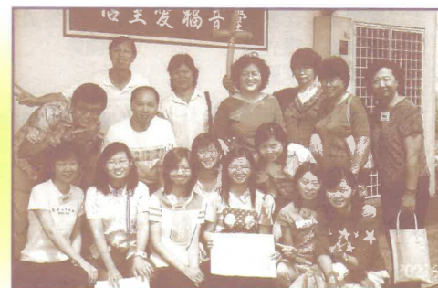
與教會肢體一起作佈道實習