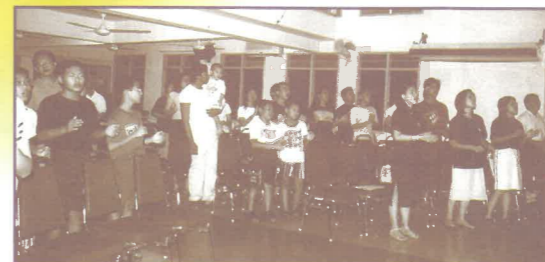
負責蕪賴十一哩信義會青少年獻心會