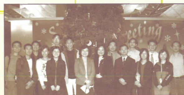
肢體到機場送行，他們的禱告和神的恩典都與我們同行。