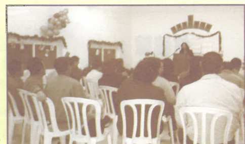
在海法教會主領聖誕節聚會，當中除了勞工外，有兩位學者決志信主。