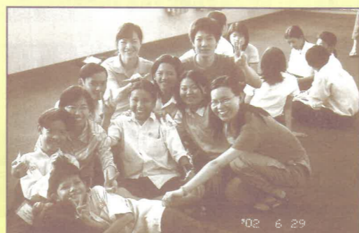
在廣聲學校園與青年人打成一片