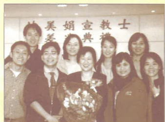
國宣西馬短宣隊員出席姊妹的差遣禮為她打氣(3/02)