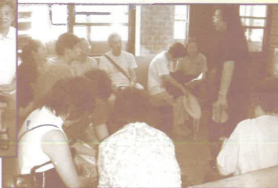
福音探訪老人大廈