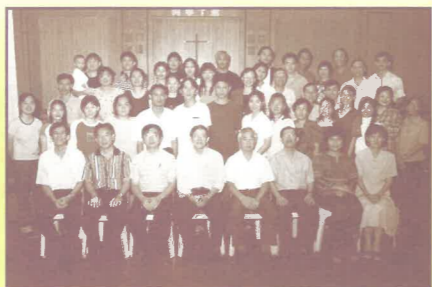
開學禮師生大合照

到目前為止，12位畢業生當中有4位申請進入神學院，2位參與教導的工作，1位成為教會的同工，其他則進入社會繼續為主做鹽做光。