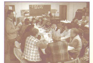
在紐約華人福音會老人團契教導佈道技巧