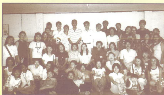
與恩典教會大合照

地點：香港短宣中心 (國宣主辦/港宣協辦，誠邀校友、各教會差傳團契、宣教關懷小組聚會遷師參與)