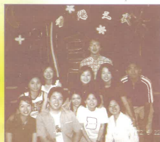
負責大專福音中心「香港之夜」佈道晚會