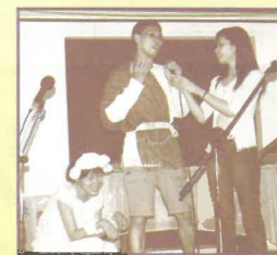
牧羊人尋回小羊的喜樂