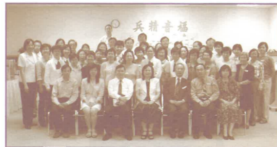
滕張佳音師母與董事同工、短宣及校友暢聚