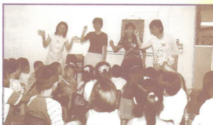
信望愛福音堂兒童佈道會