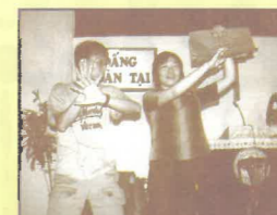
在越南人教會，以默劇表達福音內容