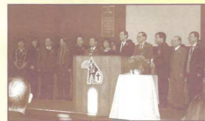
群策群力傳遞福音真象

十年前中心沒有基址，蒙一間教會慷慨借出禮堂樓上的約100尺小房間，開始短宣事工。想不到過了幾年之後，天父為我們預備了3,000千尺的地方，不單有接待處、佈道工具售賣部、佈道影音帶借用處、四個獨立的辦公室、一個會議兼佈道資源室、樓上一個可容納超過80人聚會的地方，就是我們常用來訓練的課室。