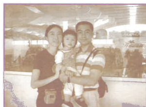
筆者與太太女兒合照

我們也特意一同靈修《使徒行傳》中保羅旅行宣教的經文，每早晨各自靈修後分享，然後禱告將這一天獻給神。很奇妙地，神每早給我們所說的話，十分適切我們每天的需要。整個旅程也十分體會神的同在與施恩，叫我們讚嘆不已。另外，看到隊員彼此相愛服侍的行動，及隨時自省認罪的態度，都使我心頭溫暖而感恩。