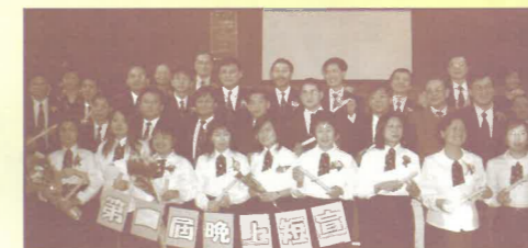
開拓晚青佈道訓練

十年前只有一位部份時間的受薪同工，今天已有六位同工，其中四位全職、一位義務同工及一位自雇式的傳媒事工主任。