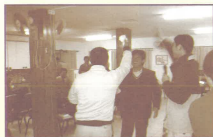
在別士巴教會中帶領活動。