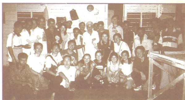
文化體驗--孟加拉外地勞工

道更明顯看見從上而來的能力。故我們願將一切的结果獻給神，只願主的旨意成就在我們身上！