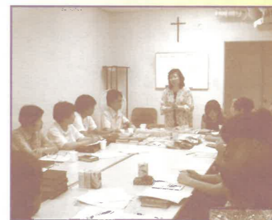
教授如何運用福音工具