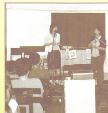
善用福音工具講解教恩