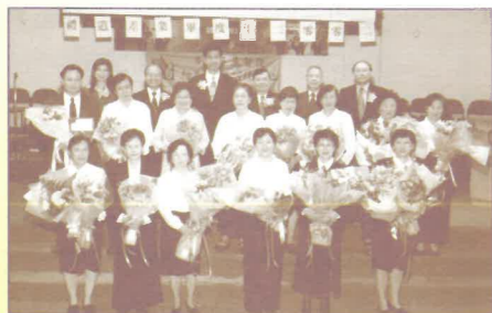
董事同工與畢業短宣、長青及參加者合照，同證 主恩。

讓我們同心的到神面前，為我們的國家、城市、教 會、家庭及個人祈禱。因為神應許說：「這稱為我名下 的子民，若是自卑、禱告、尋求我的面，轉離他們的惡 行，我必從天上垂聽，赦免他們的罪，醫治他們的地。」(代下7:14) 〇