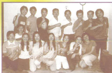
與汝來福音堂肢體一起出擊佈道