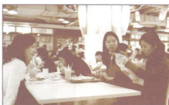
在食肆運用福音單張打入話匣

耶穌說：「常在我裡面的、我也常在他裡面，這人就多結果子，因為離了我，你們就不能作甚麼。」在短宣中心訓練部事奉，越來越體會到這節聖經的屬靈意義，如果沒有好好的建立與神的關係，沒有培養美好的屬靈生命，所作的所結的皆是徒然，恩主是不會悅納。感謝神讓我們的短宣大都願意突破屬靈生命，願意擺上自己，為主結健康豐盛的屬靈果子，榮神益人！