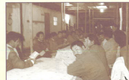
別是巴的其中一個工地，勞工們來自江蘇。