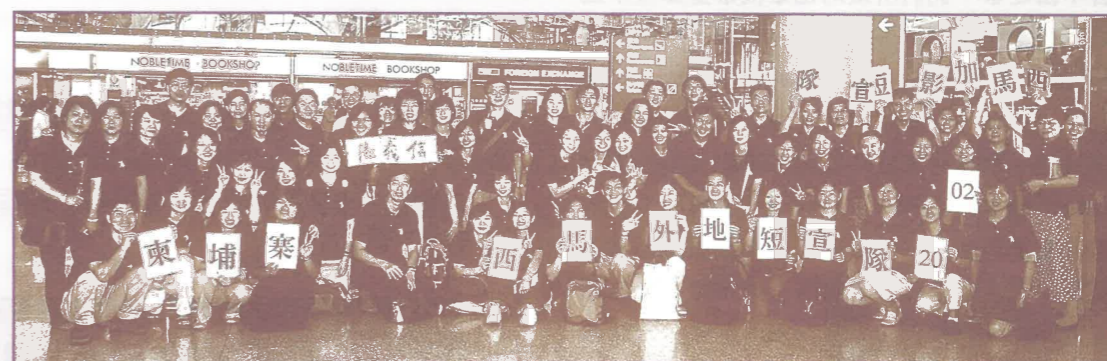
港宣主辦、國宣協辦兩年一度外地短宣隊一行65人(7位領隊、41位受訓短宣及17位參加者)在香港機場集合出發分成7隊前往柬埔寨(1隊)及馬來西亞(6隊)，與當地教會肢體一起受訓及佈道跟進，激發佈道熱。