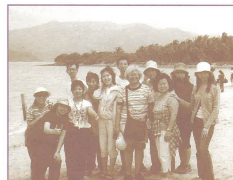
春令會在景色怡人的芽莊舉行