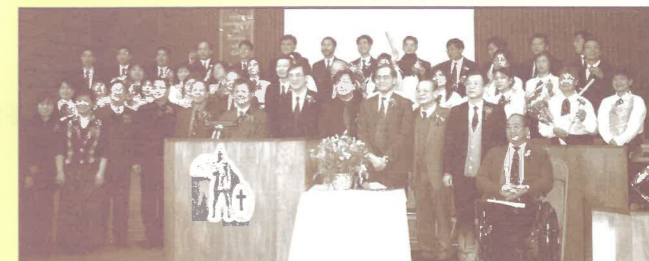
中心成立十週年感恩聚會

最初我們只有兩年短宣訓練，後來發展三個月與半年的短宣訓練。感謝天父預備，帶領我們經過了19屆的三個月短宣訓練，受訓人數超過300人。初時訓練主要