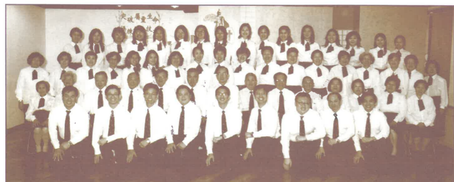
全體短宣與長青合照。(2/03)