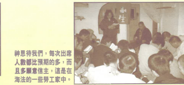
神恩待我們，每次出席人數都比預期的多，而且多願意信主，這是在海法的一些勞工家中。