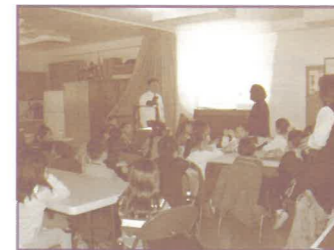
在紐約華人福音會負責兒童佈道會

在美國過境處，才得知911後所有已發 的簽證作廢，因此我們當中有成員不能過 境。處理事件的官員表示無望，力勸回程之 際，我們同心祈求，神提醒我們，祂是那位 在旱地開江河，帶領以色列人過紅海的神。 經過多番交涉的程序，眼前的紅海豁然敞 開，我們以讚美感恩進入了美國境內。