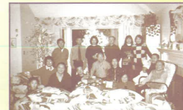
列治文佈道團職員及家人

除了每週有很多福音探訪的義工外，每月都有義工幫忙派送真理報、協助打字、雜務處理、整理資源.....他們成為短宣中心事工的好幫手。