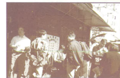
「免費量血壓」攤位佈道，接 觸70多位操普通話的福州籍民 (曼克頓唐人街)

在紐約市，人心更顯剛硬。在經濟不 景，福利缺乏，家庭衝激及恐怖襲擊之重擔 下，人顯得特別暴躁、冷漠、茫然。接觸的 人有不少來自中國，他們各人的際遇雖有不 同，但普遍感到人生曲折坎坷，較諸初來多 倫多的異方客處境差。如耶穌基督所形容的 「他們困苦流離，如羊沒有牧人一般」。