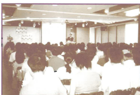
舉辦各類佈道訓練聚會