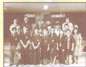
泰國短宣中心成立典禮