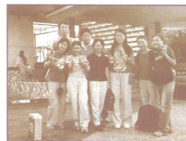
10多天在大學校園佈道