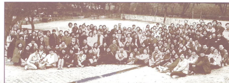
全體同工、短宣、長青、倩青戶外相交日大合照。(11/02)