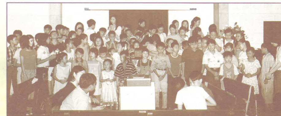
大型兒童佈道會，反應熱烈