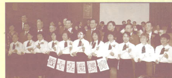
經過19屆的短宣訓練，受訓人數超過300人

為了使更多弟兄姊妹參與佈道，過去10年成立了3個的佈道團：溫哥華佈道團、三聯市佈道團與及列治文佈道團，每個星期不論寒暑，到不同的地方去探訪、傳福音及分享信息。此外，成立商職團，在職的肢體在每月的第二及第四個星期二中午，舉行不同形式的聚會，近年以查經為主；每四個月舉行一次福音午餐聚會，帶領在