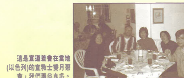
這是宣道差會在當地(以色列)的宣教士雙月聚會，我們獲益良多。