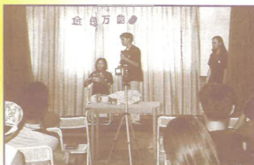
沙登生命堂首辦福音主日