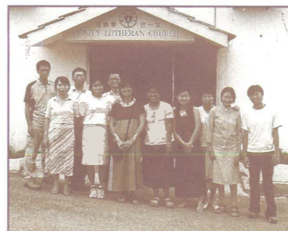
無拉港信義會合一堂門前留影