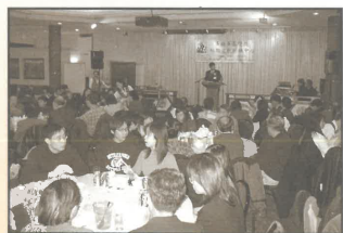
真理報加東版一週年感恩聚餐

我為他們感恩，也為神賜我這福分，與他們同走那段的人生旅程而感恩。願神引導，祝福及使用他們，榮耀主聖名！