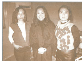
筆者(中)在臺灣路斯探訪中國留學生(攝於他們住所中)

近十年來參與短宣隊的人數倍增，單是北美每年就有數以萬計的人參與短宣行列，「短宣隊」這個話題已引發不少的討論和反思。而加拿大福音團契研究發現，在過去五年中重視短宣隊工作的教會，不但人數增長，而且也較多機會差出長期宣教士。 1 所以，他們的結論是：「倘若一間教會希望差出長期宣教士，他最不該做的事莫過於不肯差出短期宣教士」。 2 而「帶著使命、目標清晰」就是高質素短宣隊的特徵之一。「國宣短宣隊」都帶著一個「特殊任命」：就是把「短宣運動」的異象帶到世界各地，與各地弟兄姊妹一同實踐大使命，「同有一個心志，站立得穩，為所信的福音齊心努力」。