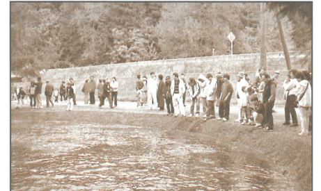
觀三文魚福音大旅行