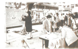
「非典型肺炎SARS」肆虐期間，與不同教會舉辦「關懷前線醫護人員福音行動」，呼籲市民發善心意哈、派發福音抗災單張等。(4-5/03)