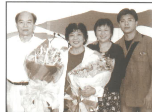
回港與弟弟參加父母的浸禮(19/10/03)