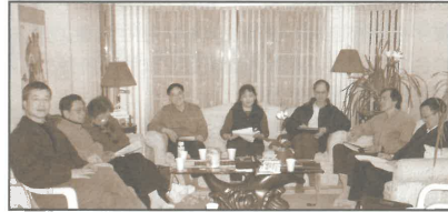
國語傳愛團職員會