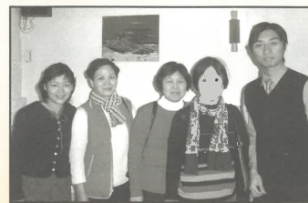
香港傳青學員拜托短宣隊探訪其未信主的家人(安恆)