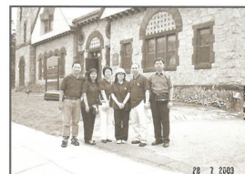
短宣隊員在教會聚會處留影