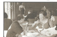
在食肆佈道中，這位女士表示十分多謝隊員肯聆聽她的辛酸