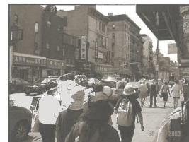
在紐約華埠街頭佈道