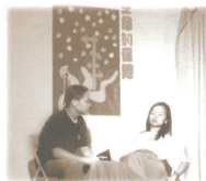
隊員十分投入地演繹領隊的「得救見證」，作為佈道會的序幕