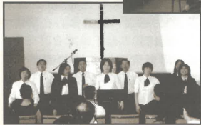
聖約翰斯短宣佈道及訓練