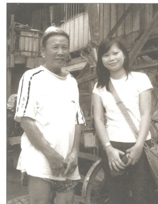
在柬埔寨，探訪當地華人

回想起從上帝呼召那刻，到真正踏上工場，期間也相隔五年之久，感謝上帝仍保守自己獻身的心志。甚願我們一起同心順服於主所頒發的大使命，讓主帶領我們由短宣發展到長宣，由本地發展到外地，由同文化到近文化、跨文化，為主作那美好的見證。誠心所願！