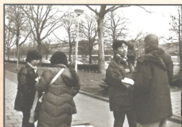
短宣隊在街頭與「耶和華見證人會」的信徒辯道(鹿特丹)