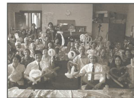
成年人也很積極和投入學習氣球佈道