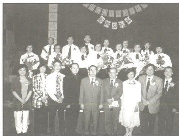
20屆畢業生與董事同工合照