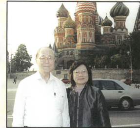
應邀出席在莫斯科舉行之AMA亞洲宣教大會(9-12/9/2003)