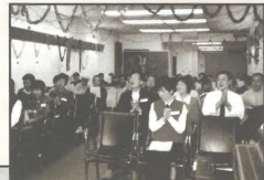
社區中心聖誕聚會