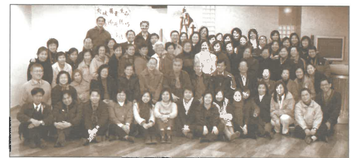
全體同工、短宣及長青合照(12/03)。