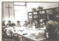
參與訓練的學員都認真投入，勇於發問和回報(鹿特丹)