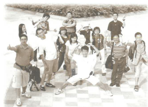
隊員大部分是第一次向海外華人傳福音，甚是喜樂