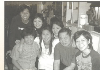
除夕夜的家聚，由教會肢體接待(鹿特丹)