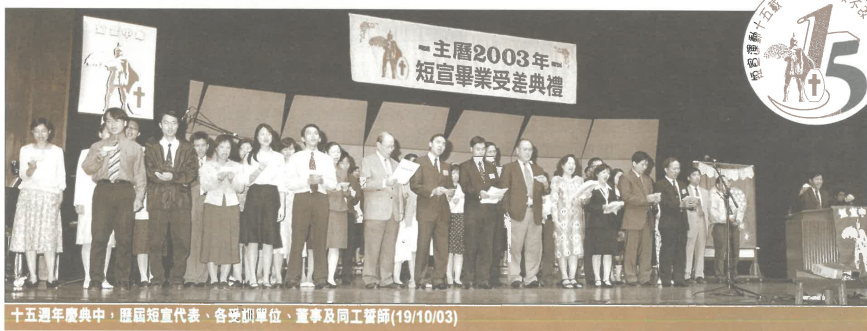
十五週年慶典中，歷屆短宣代表、各受訓單位、董事及同工督師(19/10/03)