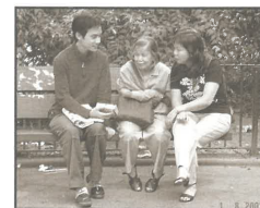
與教會肢體到公園佈道