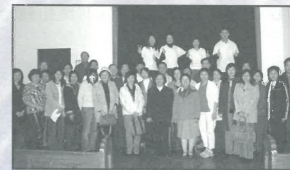
2005年8月奧克蘭短宣訓練隊出發前的「差遣禮」，同心同行！