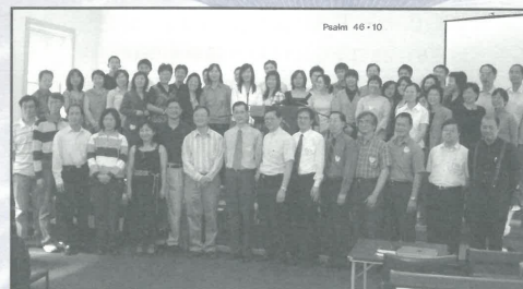
2005年畢業感恩聚會，牧者學員及雪宣董事同工，同聲讚美主！