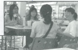
孔敬大學飯堂佈道