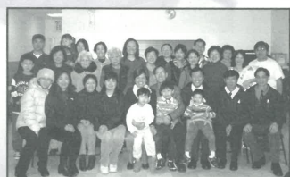
訓練聚會後與參加者合照