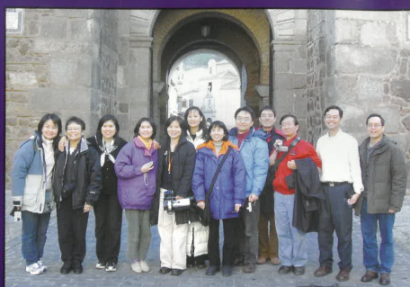
2006年西班牙馬德里短宣隊

有一位只參加約兩週外地的短宣說：「去過第一次外地短宣，就很想留下來 「繼續」耕耘與撒種，那當然是不可能。透過神的恩典