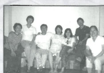
短宣隊與接待家庭