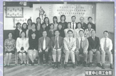
短宣中心同工合照