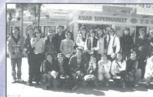
奧克蘭基督教福音堂教會的肢體還是首次街頭佈道，一齊來打氣！