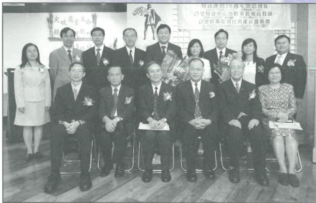
總幹事、副總幹事就職禮與顧問及董事合照