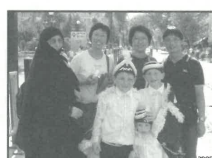
與同行割禮的人們合照