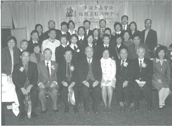
2005年11月6日短宣中心成立十五周年暨《真理報》加東版三週年感恩聚餐