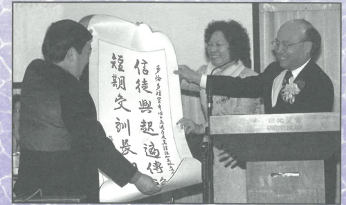
多倫多董事接受禮物