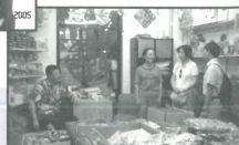
到批發市場福音探訪