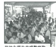
與校內學生共唱歡樂歌