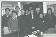
紐約的職工學習 使用工具