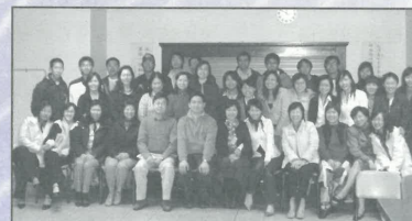
2005年中區基礎班的大合照