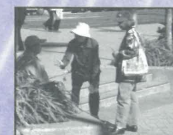
奧克蘭長青信街頭佈道