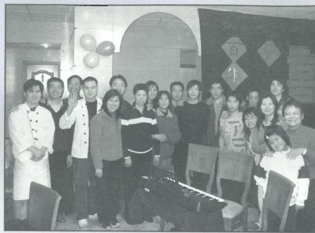
音樂見證會後大合照

我們。」對了！那好東西就是耶穌基督救人的好消息。其後，當中約有五人願意祈禱相信耶穌；感謝神，聖經說：「這福音本是神的大能，要救一切相信的。」（羅馬書1章16節）