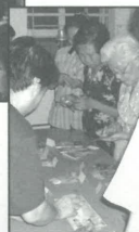
佈道訓練(工具製作)