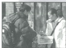
法拉盛區街頭佈道