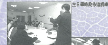
主日學時段佈道訓練