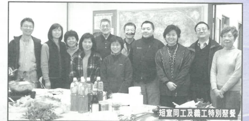
短宣同工及義工特別聚餐