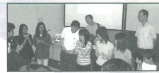
大學生英語福音班