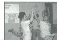
青春大晒學生佈道會

與香港短宣中心合辦 一年一度「海外華人福音需要分享會」， 將於2005年12月12日(二)晚上7:30-9:30 香港短宣中心 (沙田小瀝源源順圍28號都會廣場7/F)舉行。 屆時有短宣隊匯報、專題分享及為各工場分組祈禱等。 誠邀歷屆國宣短宣隊隊員、短宣校友、差傳小組及有興趣 更多了解海外華人福音需要的肢體出席。