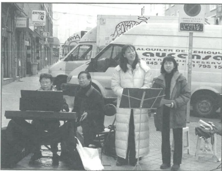
零晨三時完成佈道

總結：從十多年在香港短宣中心的事奉，轉到北美牧會，我常提醒自己要當個「傳」「道」的「人」，不要在教會四面牆內迷失方向。求主施恩憐憫，常給我新異象與行動，不負主所託。ρ