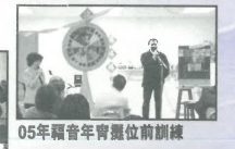
05年福音青年會領袖前訓練