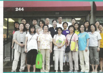
2012暑期本地短宣訓練