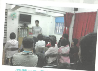
澳門平安福音堂佈道訓練