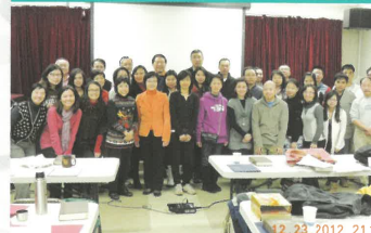
2012冬季本地短宣訓練