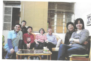
與三位慈愛家庭同工合照 (服侍自閉兒童及家長)