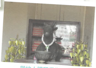
當地人膜拜偶像之一