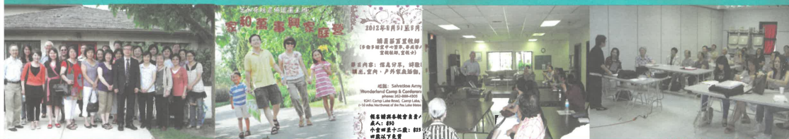
華人基督教聯合會北郊堂 普通話個人佈道訓練